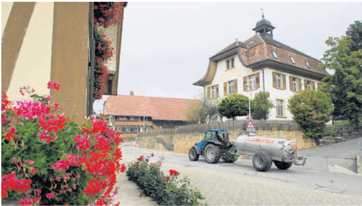
Im idyllischen Jeuss soll keine neue Mobilfunkantenne aufgestellt werden, meinen viele Bewohnerinnen und Bewohner.

JEUSS Zahlreiche Bürgerinnen und Bürger von Jeuss sind mit dem Bau einer neuen Mobilfunkantenne im Dorf nicht einverstanden. Gegen das Baugesuch der Swisscom AG sind insgesamt 68 Einsprachen eingereicht worden. Im Rahmen der laufenden Ortsplanungsrevision überlegt sich der Gemeinderat nun, Mobilfunkantennen in der Dorfzone grundsätzlich zu verbieten. Eine ähnliche Regelung der Gemeinde Urtenen-Schönbühl hat das Berner Verwaltungsgericht kürzlich gutgeheissen. Das Urteil aus Bern wird die Swisscom ans Bundesgericht in Lausanne weiterziehen. fa Bericht Seite 3