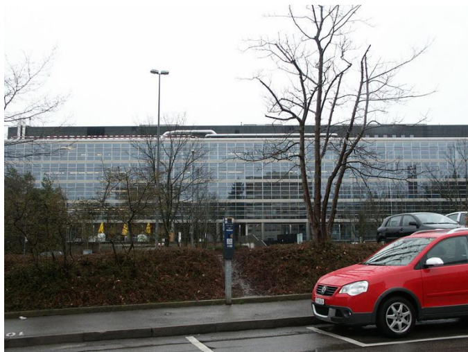
Immeuble de la banque SBS sur la Route du Jura