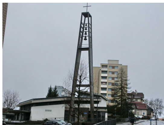
Eglise vue de ll'avenue Général Guisan