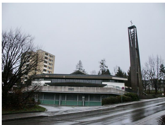
Eglise vue de la Route Ste Thérèse